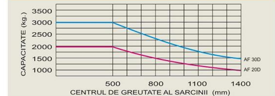
DIAGRAMA DE INCARCARE